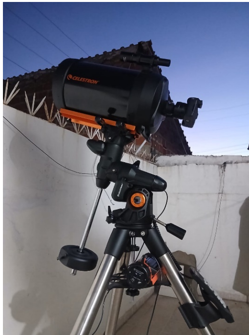
Figura 2. Telescopio SCT 8" utilizado para la observación del cometa C/2025 R3.

El cometa fue observado desde Cochabamba - Bolivia, el 4 de mayo de 2026 utilizando el equipo mostrado en la figura 2.