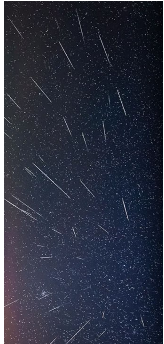
Fig. 1 Fotografía de una Lluvia de meteoros; es una composición de varias tomas a lo largo de una hora, donde se aprecia que la mayoría de los meteoros parecen provenir de una región del cielo, salvo alguno que otro esporádico que no pertenecen al radiante como se puede apreciar en la imagen.

Habitualmente, la actividad que se puede apreciar oscila entre 40 a 200 meteoros por hora en condiciones óptimas de visibilidad y durante el máximo; esto depende de diversos factores. Desde la ciudad (dada la contaminación lumínica), y si el radiante no se encuentra en el punto más alto del cielo (Cenit), entonces ese número es menor.